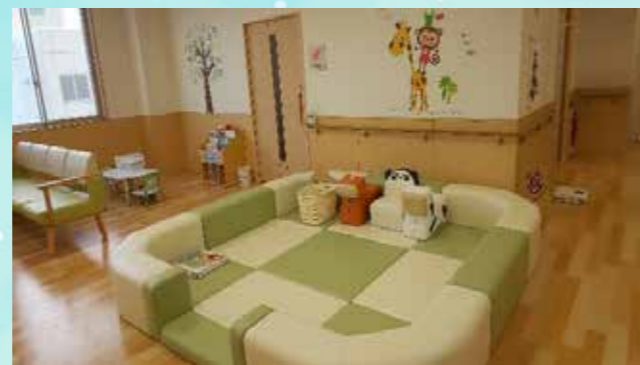
小児科待合室 (プレイルーム)