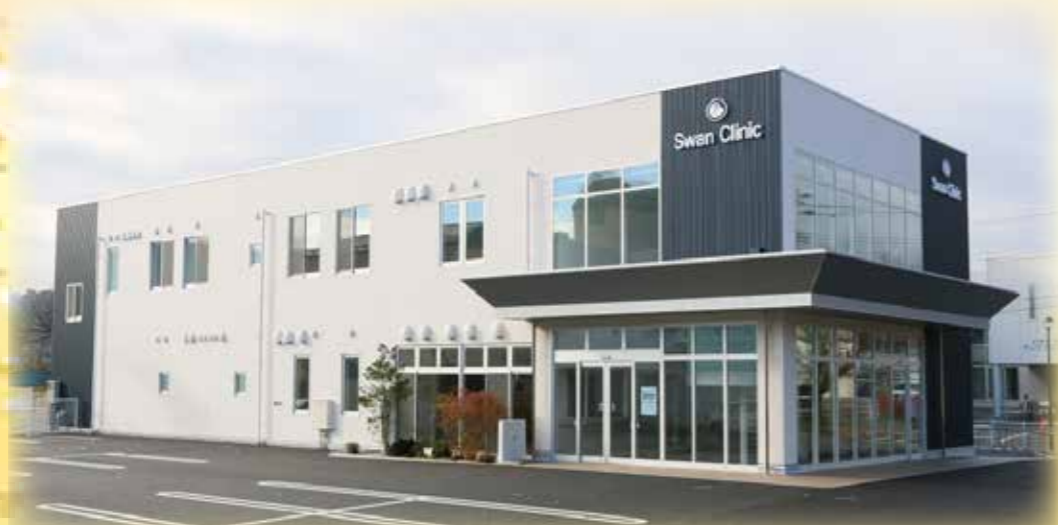
12月1日「スワンクリニック」オープン

当院のあります沖田面地区には病院、クリニック、老健、デイサービスセンター、役場等もそろいました。昭和48年の開院当時には田んぼの中の一軒家でしたが、当時を知る者にとりまして、まさに隔世の感を禁じ得ません。当院ではこれからを見据え、また、病院を次の世代に引き継ぐべく、3年前に現在地に新築移転しました。