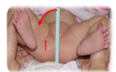
脚の開きが悪い例